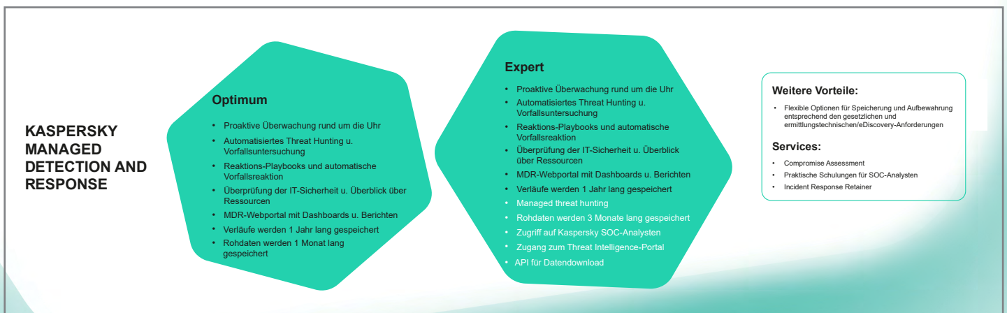
Abbildung 2. Stufen von Kaspersky MDR

Um den Ansprüchen von Organisationen jeglicher Größe und unterschiedlich ausgereiften IT-Sicherheitssystemen gerecht zu werden, wird Kaspersky MDR in zwei Stufen angeboten (Abbildung 2). Kaspersky EDR Optimum erhöht unmittelbar den Sicherheitsstatus Ihrer IT-Systeme, ohne dass in zusätzliche Mitarbeiter oder Expertise investiert werden muss, und bietet in einer schnellen, mühelosen Bereitstellung Resilienz gegenüber schwer erkennbaren Angriffen. Kaspersky MDR Expert enthält sämtliche Features der Optimum-Version und bietet darüber hinaus weitere Funktionen und Flexibilität für erfahrene IT-Sicherheitsteams, die die Auswahl und Untersuchung von Vorfällen an Kaspersky abgeben und ihre begrenzten eigenen IT-Sicherheitsressourcen auf die Abwehr der ihnen vorgelegten kritischen Fälle richten können.